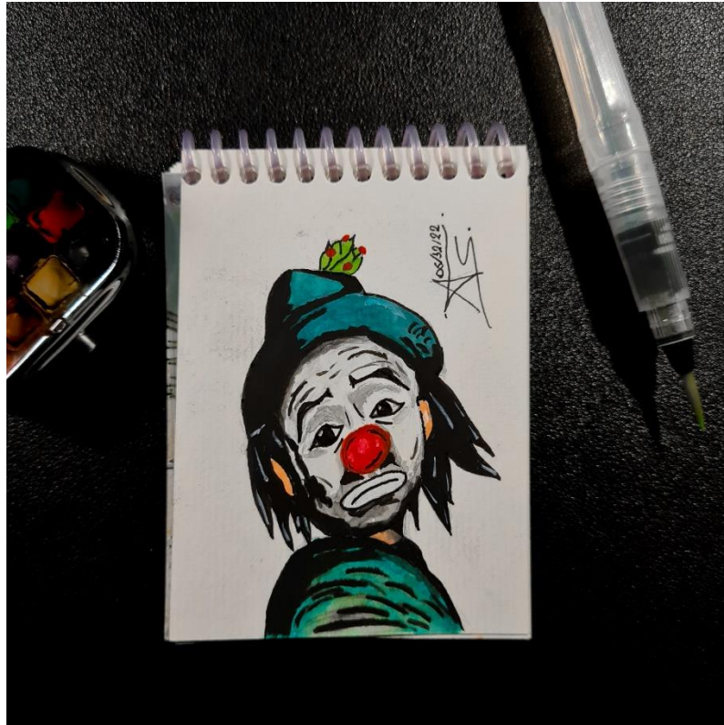
Autoria: Anderson Silva (2022).