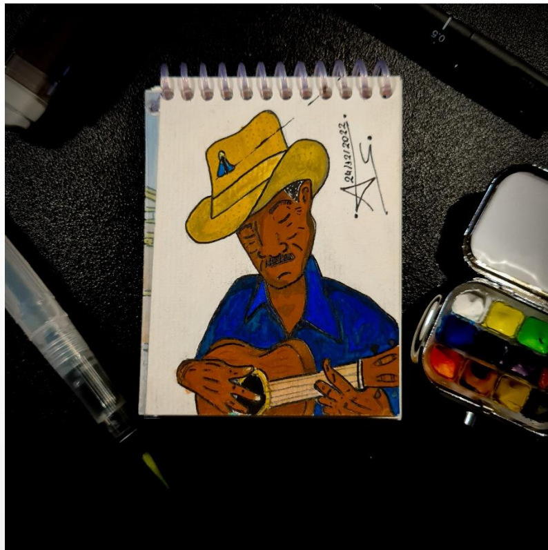
Autoria: Anderson Silva (2022).