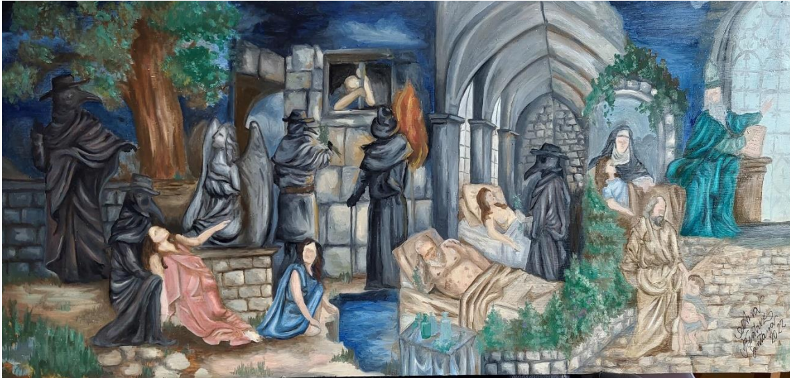
Figura: Bases do princípio da Integralidade na Peste Bubônica. Óleo sobre tela. Autoria de Ana Beatriz Santana Silva (2022).

A pintura se configura como uma das mais antigas manifestações artísticas da humanidade. Desde o período pré-histórico, há registros de pinturas nas paredes de cavernas, como forma de registrar e comunicar fatos do cotidiano. Entende-se, assim, que a pintura instiga à uma leitura imagética, isto é, a uma decodificação da imagem e, por conseguinte, interpretação acerca do que fora retratado.