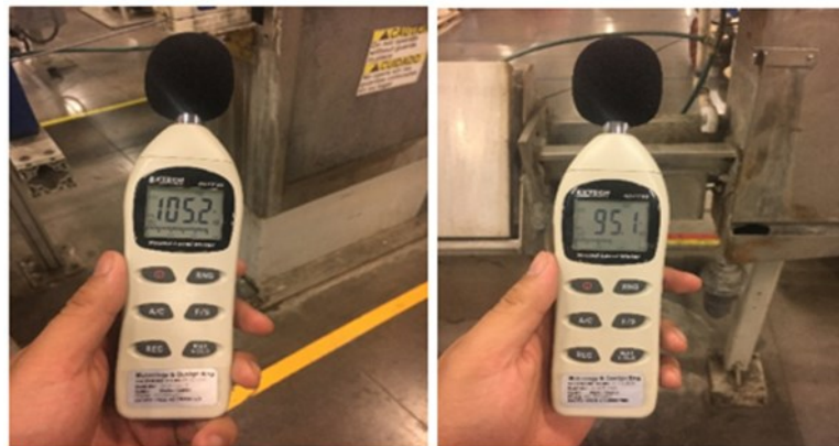
Figura 6 Niveles de Ruido en Proceso de Extrusión Utilizando Sonómetro Calibrado

La otra fuente de información en la Figura 6 niveles de ruido en proceso de extrusión utilizando sonómetro calibrado, se muestran los decibeles en las fuentes de ruido, donde se observan decibeles de 95 a 105,3, las mediciones fueron tomadas el día 4 de abril del 2019 durante el turno nocturno en el área de extrusión.