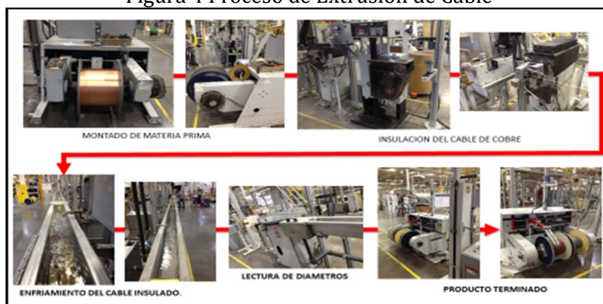
Figura 4 Proceso de Extrusión de Cable

temperatura aproximada de 150 grados Celsius y forra el cable desnudo de cobre, después para a una canaleta con agua que enfría el cable, estos es tiene un pequeño dispositivo que se llama “air wipe”, que seca el cable con aire comprimido y esta es la fuente principal de ruido esta parte es crítica, ya que, si no se seca debidamente el cable, puede presentar desperfectos en la aislación o falla de prueba eléctrica. Después el cable se lleva al área de empaque.