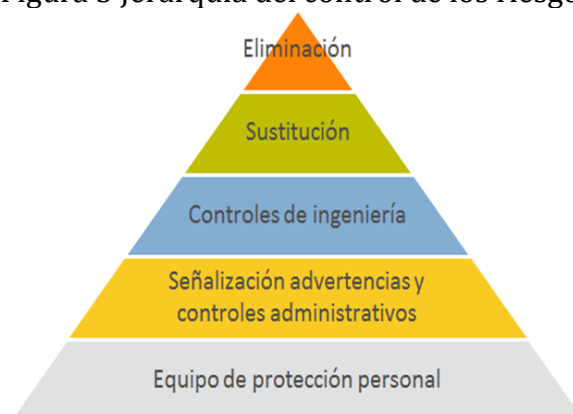
Figura 3 Jerarquía del control de los riesgos

El control es el proceso mediante el cual se instrumentan las medidas de seguridad, según Reglamento Federal de Seguridad y Salud en el Trabajo de México, derivadas de la evaluación de contaminantes del ambiente laboral. Los controles de los riesgos son la base para definir aquellos que se deben de aplicar o bien mejorar para minimizar los riesgos. Como lo muestra la figura 3 Los controles cuentan con una jerarquía, los cuales son eliminación, sustitución, controles de ingeniería, controles administrativos y equipo de protección personal (Ulloa-Enriquez, 2012).