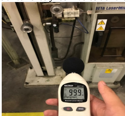
Figura 8 Air wipe anteriores y los niveles de ruido que generaban

En la Figura 8 se muestran los antiguos air wipe que estaban en las máquinas y los niveles de ruido que generaban, de los cuales ya se inició con el proceso de reemplazo cada uno cuesta alrededor de 400-600 dólares, se llevan ya instalados 18 de ellos.