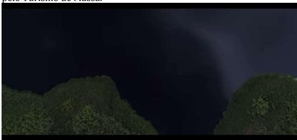
Imagem 1 – Cena inicial do documentário, aludindo a um espaço virginal que viria a ser invadido pelo Turismo de Massa.