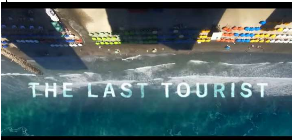
Imagem 2 – Cena inicial do documentário, aludindo a um espaço virginal que viria a ser invadido pelo Turismo de Massa.