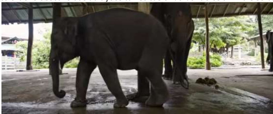
Imagem 5 – Cena de elefantes acorrentados e visivelmente estressados, denunciando o tratamento cruel e obscuro das atrações turísticas envolvendo os animais selvagens.