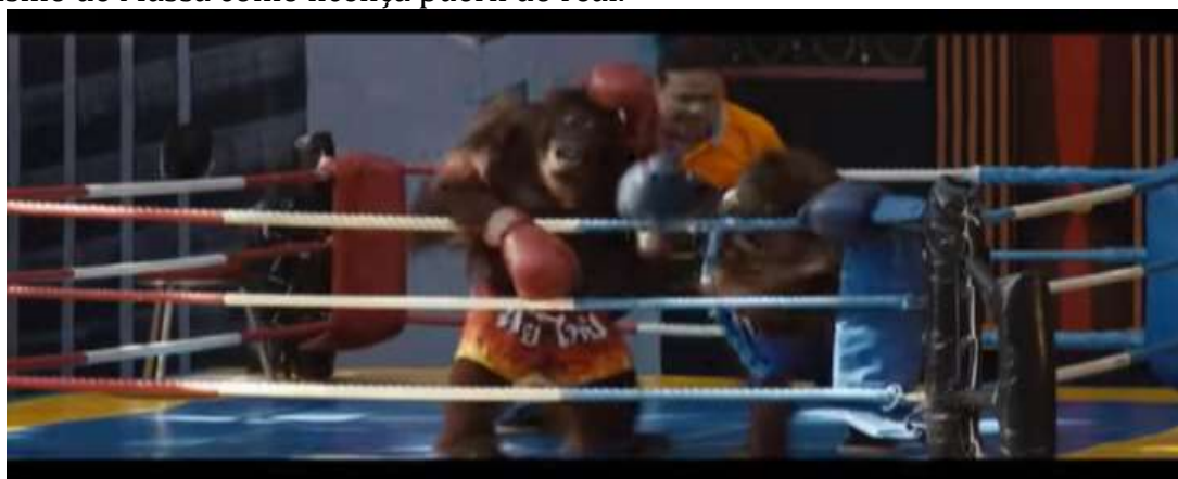
Imagem 3 – Cena de luta de boxe entre orangotangos, ilustrando o viés de absurdo, comicidade e quebra de expectativas morais-emotivas no sentido de associação do Turismo de Massa como licença pueril do real.