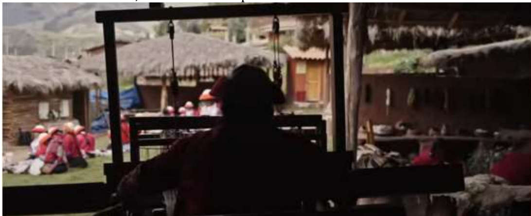
Imagem 6 – Cena de mulheres de uma comunidade local realizando os seus trabalhos tradicionais e ancestrais, desenvolvidos para o turismo comunitário.